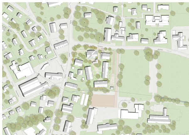
Dachaufsicht mit Umgebung