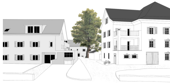
Erschliessung vom Norden