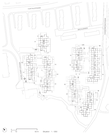
Situationsplan, Stadt Zürich, Liegenschaftenverwaltung