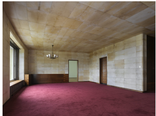
Wohnzimmer, Decken und Wände aus Paneele mit Pergament bekleidet