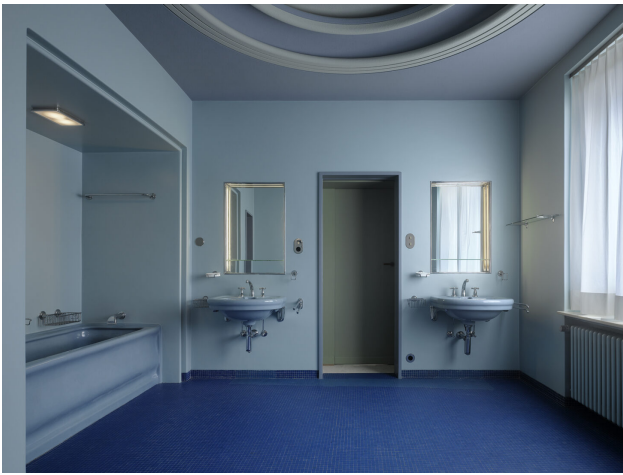
Blaues Bad zwischen Herren - und Damen Schlafzimmer