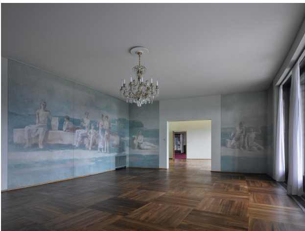
Esssaal mit Wandmalereien von Karl Waser