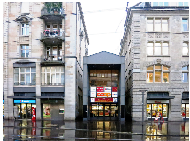
Haupteingang bis 2020 - Bild PST