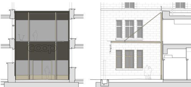
Haupteingang Ansicht & Schnitt