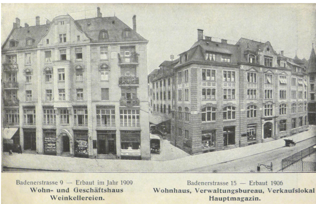
Badenerstrasse 9/15, Stadtarchiv Zürich