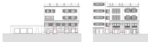
West- & Südfassade (Münsterhof 12)