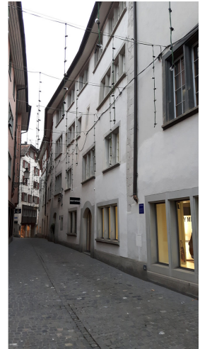
In Gassen 5