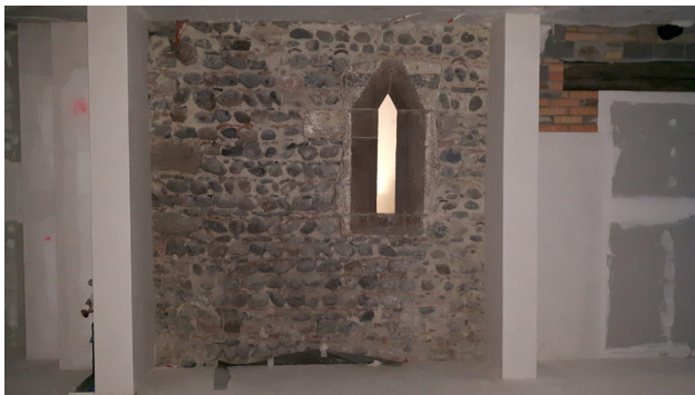
In Gassen 5