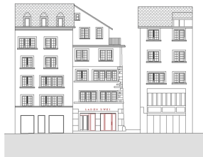
Ostfassade (In Gassen 5)