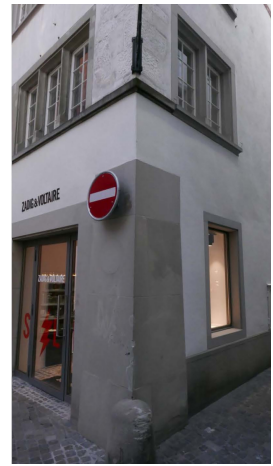
In Gassen 5, vorher nachher