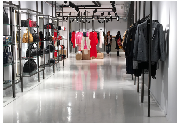
In Gassen 5