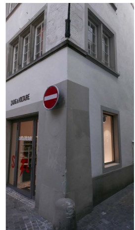
In Gassen 5, vorher nachher