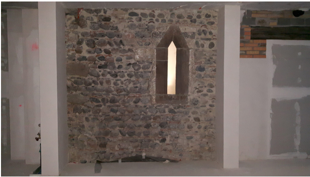
In Gassen 5