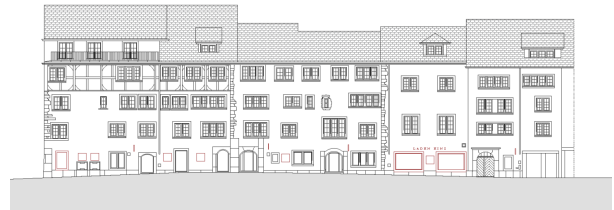
Nordfassade (In Gassen 5)