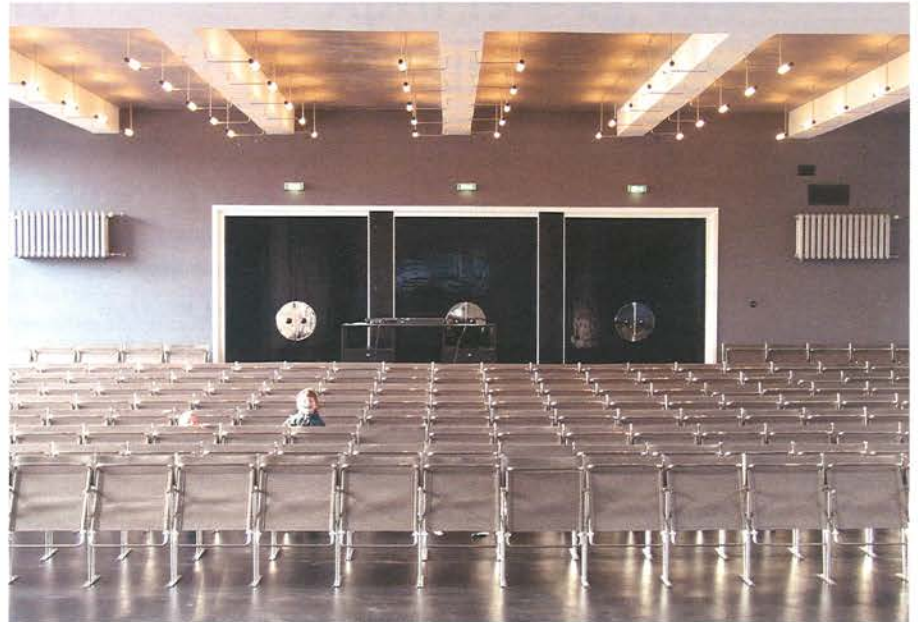
Bauhaus Dessau | Gropiusallee 38, 06846 Dessau | www.bauhaus-dessau.de | täglich 10–18 Uhr | Ausstellung „Ikone der Moderne“ bis 6. März | Anlässlich der Ausstellung und des Jubiläums sind im Jovis-Verlag/